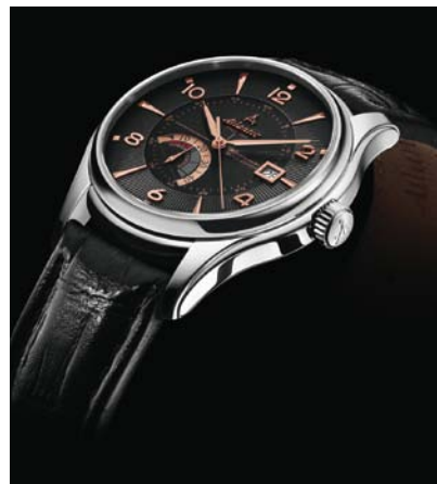
ATLANTIC, montre Suisse automatique et mécanique avec mouvement ETA.

Catalogue disponible sur demande au 03 81 500 594